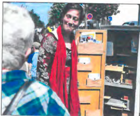
La compagnie bourguignonne Caracol propose de (beaux) mots pour soigner les maux... Une intervention très poétique.

« La petite pharmacie ambulante n'a pas désempli et les patients sont repartis, soulagés, avec une ordonnance poétique roulée dans un étui. « Si vous écoutez bien, chuchote la conteuse, vous apprendrez pourquoi nous avons tous un petit sillon entre le nez et la lèvre supérieure ... »